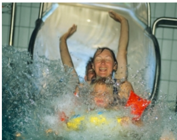
Die Rutsche im Hössenbad

Erleben Sie die Wasserwelt des Westersteder Hössenbads – ob zum Leistungssport oder einfach zur Erholung. Durch unsere Kombination aus Freibad und Hallenbad können Sie die vitalisierende Wirkung des Wassers in allen Jahreszeiten genießen.