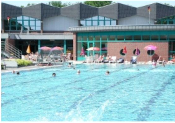
Blick über das Freibad

Von drinnen nach draußen: während der Sommersaison sind die großen Türen des Hallenbades zum Freibad hin offen, so dass von Mai bis September insgesamt zwei attraktive "Wassermassen" für die Freunde des kühlen Nass zur Verfügung stehen.